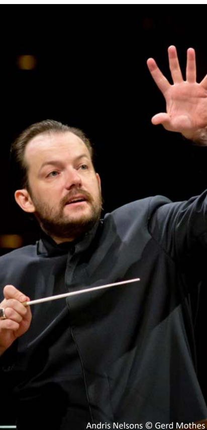
Andris Nelsons

Vom gebürtigen Leipziger Richard Wagner erleben Sie den „Tannhäuser“ in einer sensationellen Besetzung und mit drei Rollendebüts: Jonas Kaufmann (Tannhäuser), Marlis Petersen (Elisabeth) und Elna Garanča (Venus). Dazu genießen Sie die Uraufführung der Tanzkreation „Träume“ von Choreograph Emanuel Gat und hören Christian Gerhaher im „Deutschen Requiem“ von Johannes Brahms. Des Weiteren haben Sie die Möglichkeit dabei zu sein, wenn das große Orchesterwerk „Der Zorn Gottes“ von Gewandhauskomponistin Sofia Gubaidulina und Bruckners Siebte Symphonie erklingen.