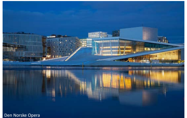
Den Norske Opera