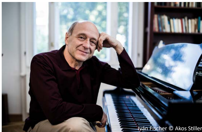
Iván Fischer