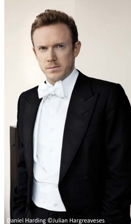
Daniel Harding

Programm- und/oder Besetzungsänderungen vorbehalten!