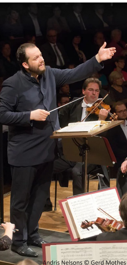
Andris Nelsons

Freuen Sie sich auf unvergessliche Tage und feiern Mahler im fabelhaft klingendem Konzertsaal des Gewandhauses gemeinsam mit dem Gewandhausorchester, dem Symphonieorchester des Bayerischen Rundfunks, dem Budapest Festival Orchestra und dem Gustav Mahler Jugendorchester. Es erwarten Sie hochklassige Konzertereignisse, wie sie in dieser Intensität vielleicht nie wieder hörbar sind! Da müssen Sie einfach dabei sein!