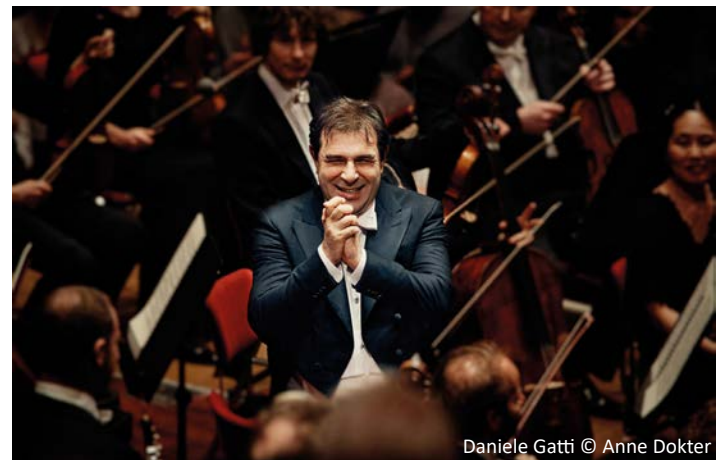
Daniele Gatti