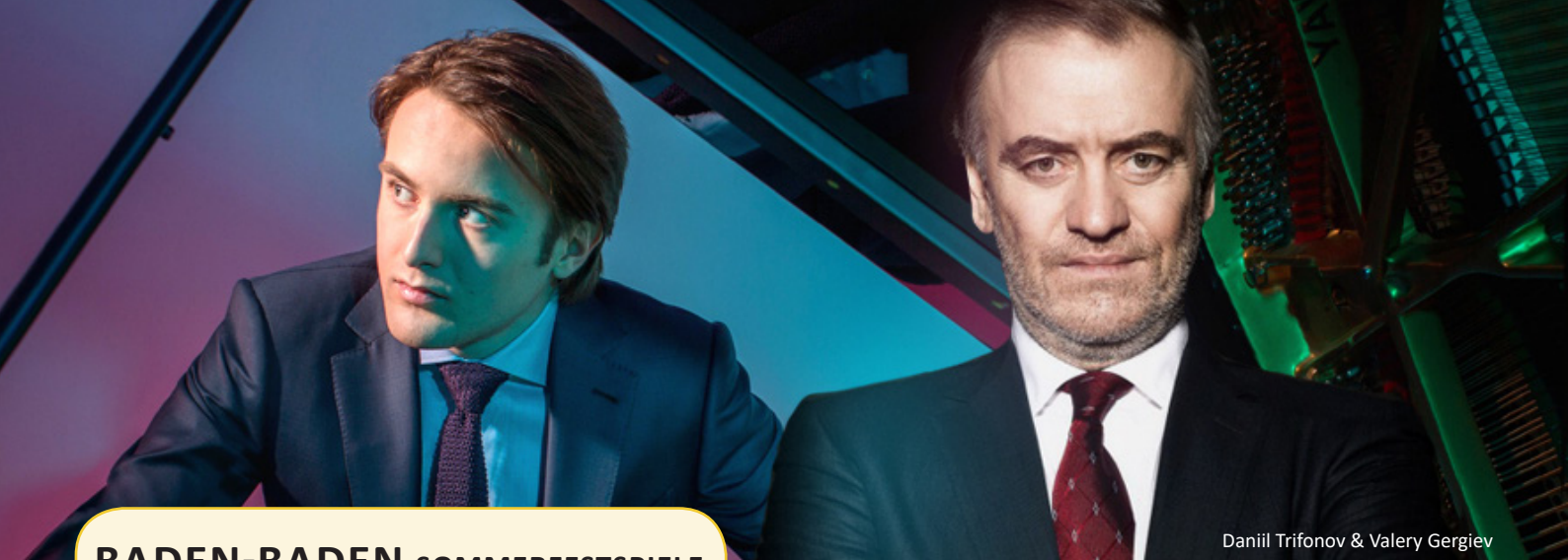
Daniil Trifonov & Valery Gergiev