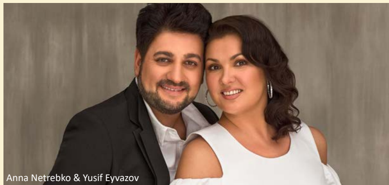
Anna Netrebko & Yusif Eyvazov